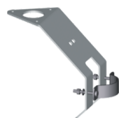
Halter compact 506347

Der Halter dient zur Befestigung eines Windgeber des Typs Compact an einem Geräteträger, Mast oder Rohr.